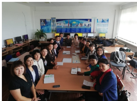
Сурет 1 – Екібастұз қаласының тарихшы ұстаздары Жаңартылған білім мазмұны курсына 2018-2019 жж.

Қазақстан Республикасының Президенті Н. Ә. Назарбаев бастамасымен «100 нақты қадам» Ұлт жоспарын іске асыру аясында ЭЫДҰ елдерінің стандарттары негізінде адам капиталының сапасын көтеруге бағытталған білім беру саласындағы 5 қадам жоспарланған болса, оның үшеуі жалпы орта білім беру жүйесіне қатысты [1]. Осы үш қадамға нақтырақ тоқталып өтсем 76-қадам: 12 жылдық білім беруді кезең-кезеңімен енгізу, функционалдық сауаттылықты дамыту үшін мектептегі оқыту стандарттарын