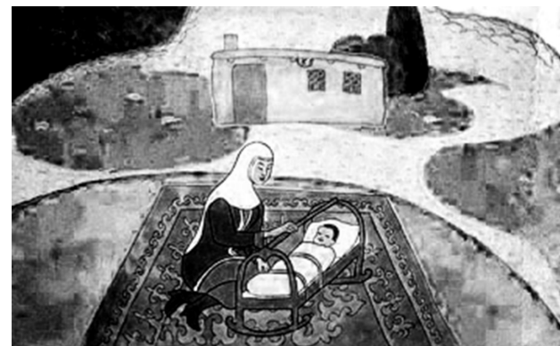
Рисунок 1 – Кадр из мультфильма «Почему у ласточки хвост рожками»

«Почему у ласточки хвост рожками» – рисованный мультипликационный фильм 1967 года, который создал режиссёр Амен Хайдаров на студии «Казахфильм» по мотивам казахской народной сказки. К мультфильму было сделано два варианта озвучания: на русском и казахском языках [1].